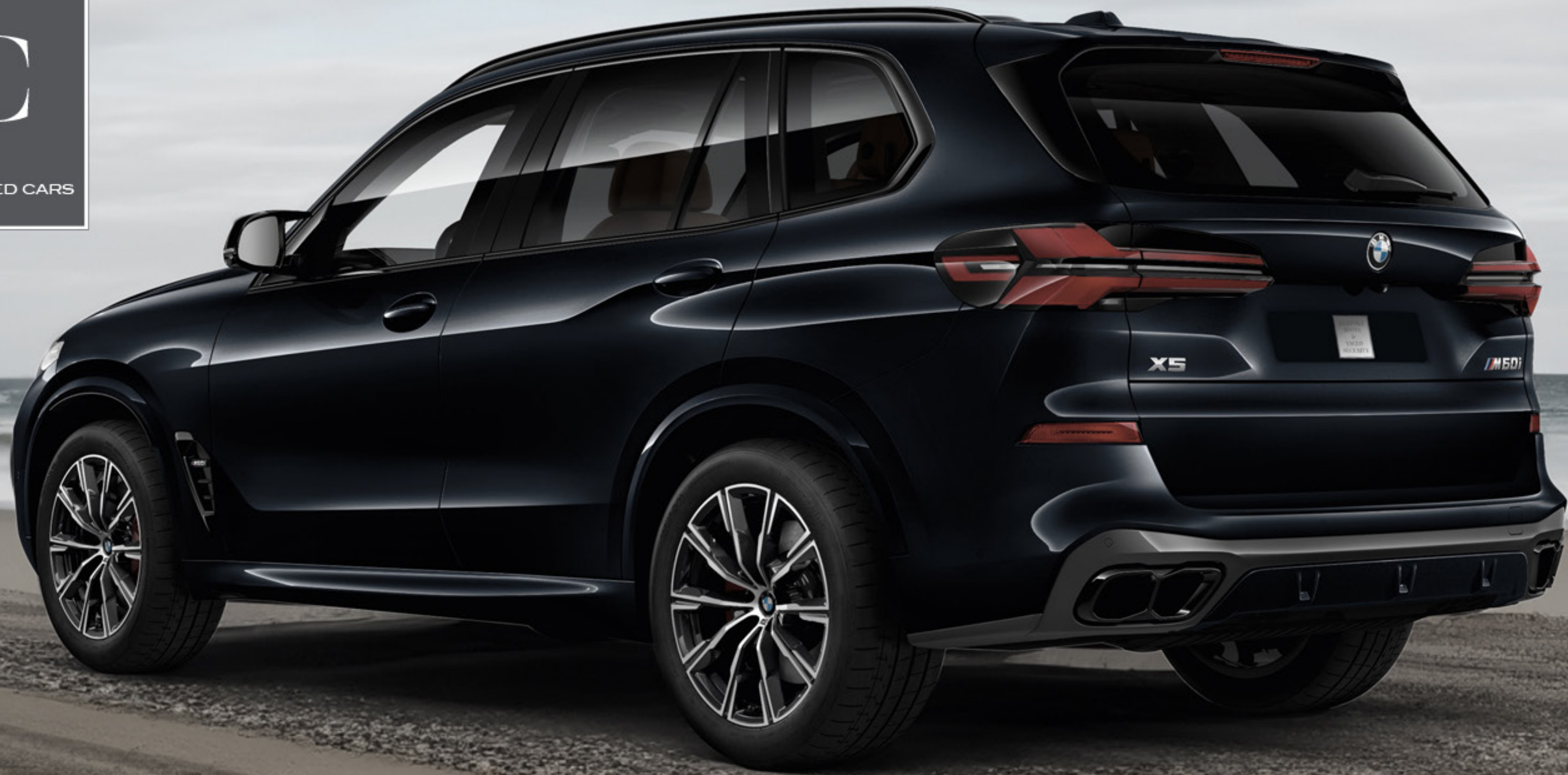
BMW X5 M60i Protection Bulletproof Armoring VR6