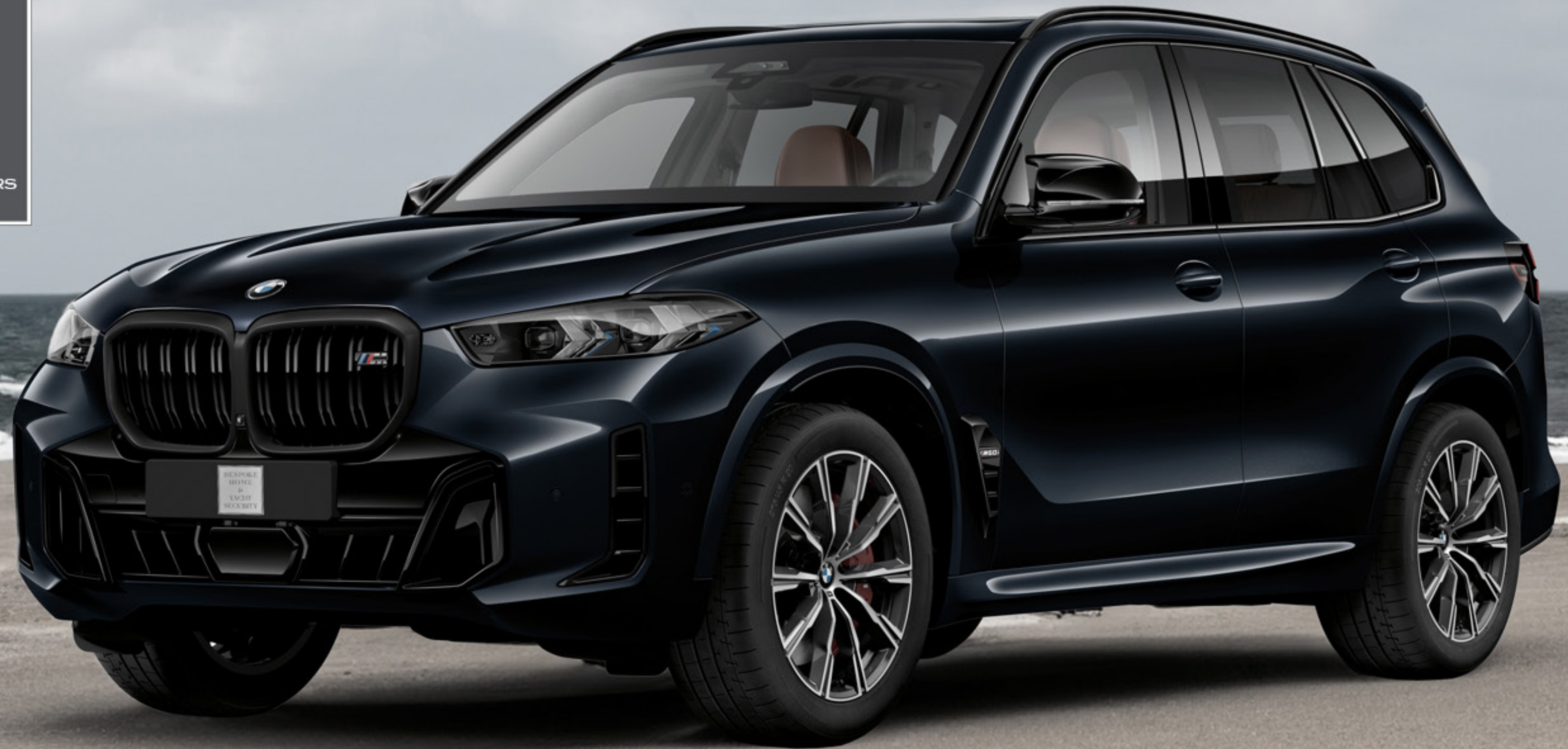
BMW X5 M60i Protection Bulletproof Armoring VR6