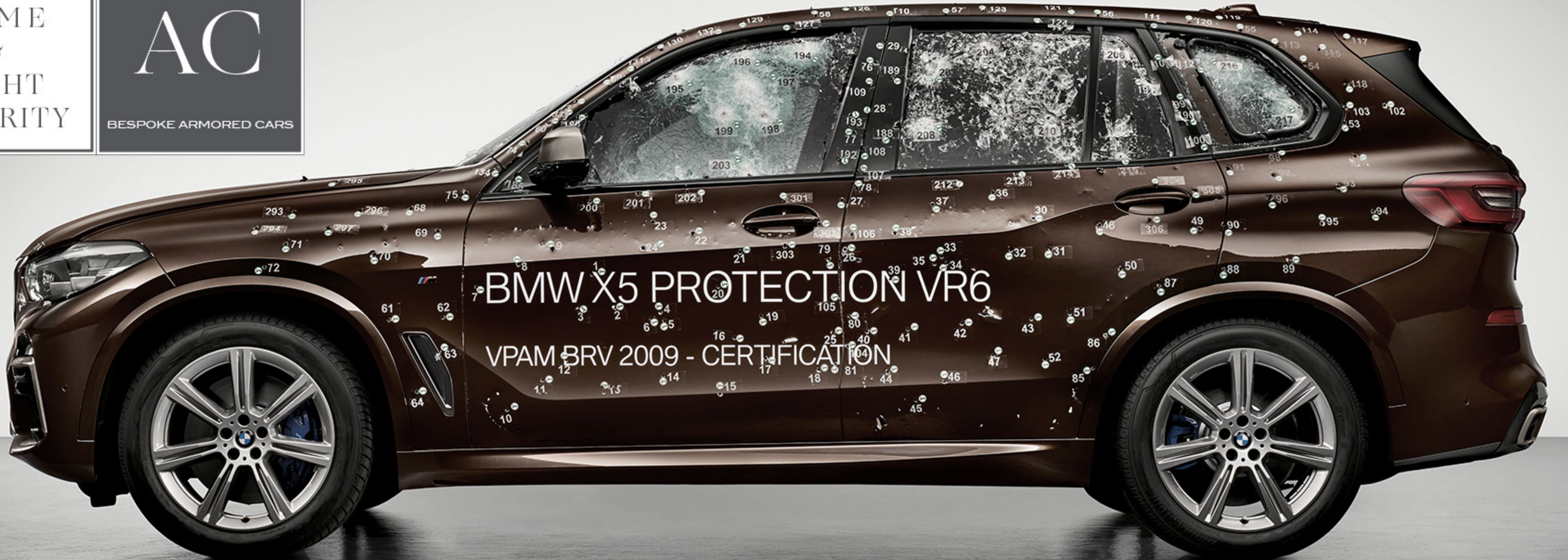
BMW X5 M60i Protection Bulletproof Armoring VR6